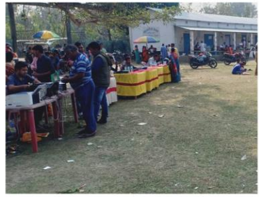
কোচবিহারের সিতাই ব্লকে দুয়ারে সরকার শিবিরে পরিষেবা প্রদান।