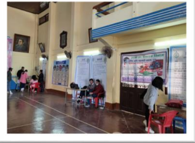
ক্রেতাদের সচেতনতা প্রসারে কালিম্পাং জেলায় বিশেষ শিবির

সহায়তার জন্য (১০৭০ / ২২১৪-৩৫২৬) নম্বরে সরাসরি ফোন করুন অথবা আপনার নিকটতম 'বাংলা সহায়তা কেন্দ্র'-এ যোগাযোগ করুন।