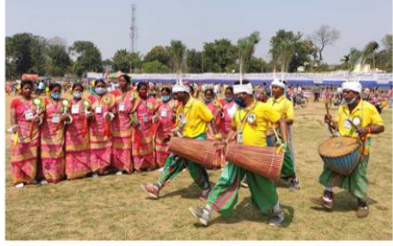
দুর্গাপুর নগর নিগমের লাল ময়দানে আদিবাসী লোক শিল্পীদের পরিবেশনায় উজ্জ্বল দুয়ারে সরকার শিবির