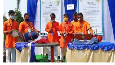
প্রচার করি কন্যাশ্রী, লক্ষ্মীর ভান্ডার সবার জন্য পাশে দুয়ারে সরকার - বাগনান - ২ ব্লক, হাওড়া