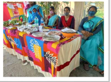
বিকিকিনির পসরা নিয়ে দুয়ারে সরকারের শিবিরে আমরা - স্বয়ন্তর গোষ্ঠীর সদস্যরা - মেখলিগঞ্জ, কোচবিহার

সহায়তার জন্য (১০৭০ / ২২১৪-৩৫২৬) নম্বরে সরাসরি ফোন করুন অথবা আপনার নিকটতম 'বাংলা সহায়তা কেন্দ্র'-এ যোগাযোগ করুন।