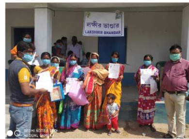
শুভেচ্ছা পত্র নিয়ে খুশী মন সবার মায়েদের পাশে সদা দুয়ারে সরকার। পুষ্কা ব্লক, পুরুলিয়া