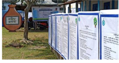
কোচবিহারের তুফানগঞ্জ - ২ ব্লকে লক্ষ্মীর ভান্ডার মা-বোনদের পাশে সদা দুয়ারে সরকার