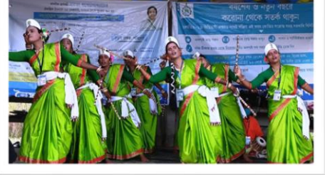
দুয়ারে সরকার শিবিরে নৃত্যের তালে তালে প্রচার লোকপ্রসার প্রকল্পের শিল্পীদের - ময়না ব্লক, পূর্ব মেদিনীপুর