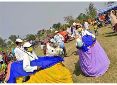
পরিষেবা প্রদান সহ ষোড়া নাচের উপস্থাপন দুয়ারে সরকারের শিবিরে পাই প্রাণের স্পন্দন - মুরারই - ২ ব্লক, বীরভূম