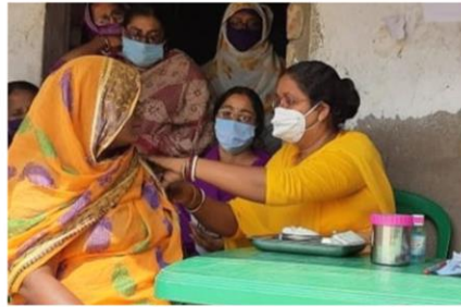
দক্ষিণ ২৪ পরগণার মথুরাপুর ১নং ব্লকে দুয়ারে সরকার শিবিরে অন্যান্য পরিষেবা দেওয়ার পাশাপাশি চলছে টিকাকরণ