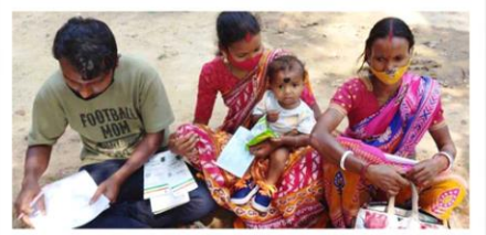
পুরো পরিবারের জন্য পরিষেবা নিয়ে দুয়ারে সরকার - সদর ব্লক, পশ্চিম মেদিনীপুর