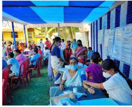
স্বাস্থ্যের খেয়াল সহ পরিষেবা প্রদান দুয়ারে সরকার - গ্রাম শহরের প্রাণ - ঘাটাল ব্লক, পশ্চিম মেদিনীপুর