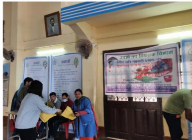
কালিম্পাং জেলায় ক্রেতা সুরক্ষা সংক্রান্ত সচেতনতা