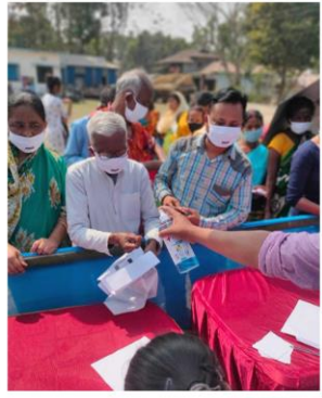
সাবধান ও সুরক্ষিত, ভালো হোক সবার আমাদের পাশে আছে দুয়ারে সরকার - জলপাইগুড়ি জেলা