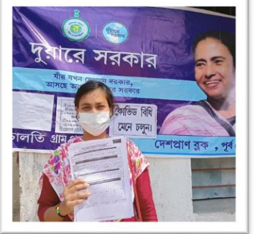
স্বাস্থ্যের সুরক্ষা বাংলার প্রতি ঘরে দরকার, স্বাস্থ্যসাহাযী প্রকল্প নিয়ে দুয়ারে সরকার। দেশপ্রাণ ব্লক, পূর্ব মেদিনীপুর