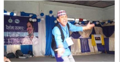
দার্জিলিং-এর তুখদা ব্লকে লোকশিল্পীর প্রচার অভিনবত্বের ছোঁয়া নিয়ে দুয়ারে সরকার