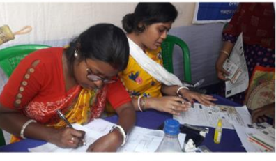
নদিয়া জেলার চাকদহ ব্লকের কমলপুরে একটি শিবিরে লক্ষ্মীর ভান্ডার প্রকল্পের ফর্ম পূরণ করছেন গৃহলক্ষ্মীরা