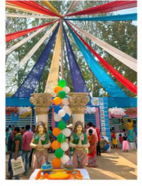
পূর্ব বর্ধমান জেলার বর্ধমান-২ ব্লকে মডেল দুয়ারে সরকার শিবির।