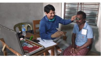
চক্ষু পরীক্ষণ কেন্দ্র, দুয়ারে সরকার শিবিরে। এলাহাবাদ গ্রাম পঞ্চায়েত, বংশীহারি ব্লক, দক্ষিণ দিনাজপুর।