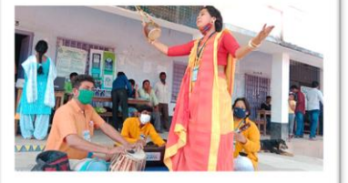
বীরভূম জেলার সাঁইথিয়া পৌরসভা এলাকায় দুয়ারে সরকার শিবিরে লোকপ্রসার প্রকল্পের শিল্পীদের অনুষ্ঠান পরিবেশনা

সহায়তার জন্য (১০৭০ / ২২১৪-৩৫২৬) নম্বরে সরাসরি ফোন করুন অথবা আপনার নিকটতম 'বাংলা সহায়তা কেন্দ্র'-এ যোগাযোগ করুন।