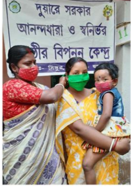
হুগলি জেলার সিঙ্গুর ব্লকের দুয়ারে সরকার শিবিরে আবেদনকারীকে মাস্ক পড়িয়ে দিচ্ছেন মহিলা স্বনির্ভর গোষ্ঠীর সদস্য