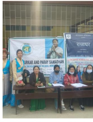
দার্জিলিং জেলার কাশিয়াং ব্লকের দুয়ারে সরকার শিবিরে পরিষেবা প্রদান