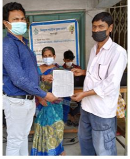
দুয়ারে সরকার শিবিরে বিনামূল্যে সামাজিক সুরক্ষা যোজনার পাশবই আপডেট। ব্লক- শহীদ মাতঙ্গিনী, পূর্ব মেদিনীপুর