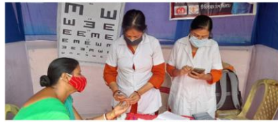
দক্ষিণ ২৪ পরগণার সোনারপুরে দুয়ারে সরকার শিবিরে স্বাস্থ্য পরীক্ষার আয়োজন।