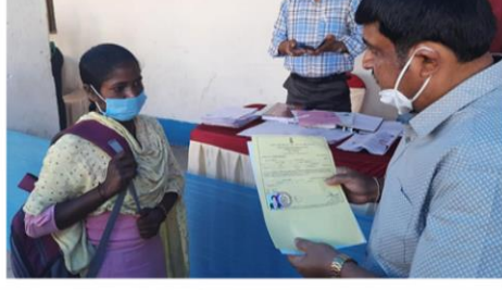
দুয়ারে সরকার শিবির পরিদর্শনে জেলাশাসক, পুরুলিয়া। জনৈক উপভোক্তাকে জাতিগত শংসাপত্র ও মাননীয় মুখ্যমন্ত্রীর শুভেচ্ছা বার্তা প্রদান করছেন জেলাশাসক, পুরুলিয়া। বাঘমুন্ডি ব্লক, পুরুলিয়া।