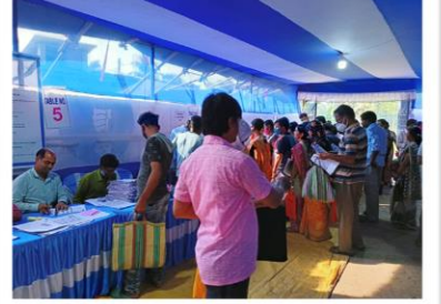
পশ্চিম মেদিনীপুর জেলায় দাসপুর-২ ব্লকে দুয়ারে সরকার শিবিরে বিভিন্ন প্রকল্পের পরিষেবা প্রদান